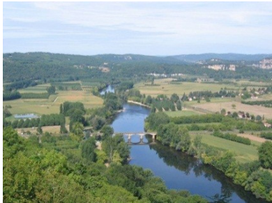
La Dordogne vue de Domme

Une autre formule pour découvrir la Dordogne :