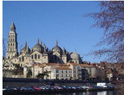
Périgueux – Cathédrale St Front